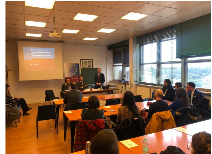
Immagine del kick-off dei Master.

Il master di II livello in Europrogettazione per PA e Organizzazione internazionali si pone l'obiettivo formativo di incentivare lo studio di tematiche e discipline che agevolino e semplifichino l'accesso alle fonti di finanziamento europee e la loro buona amministrazione, valorizzando le capacità progettuali degli studenti e creando un network di collaborazione e scambio nazionale ed internazionale.